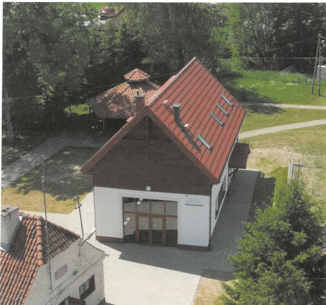
Świetlica wiejska w Boguchwałach, gmina Miłakowo: